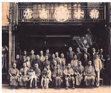
大正5年前列左から4、5人目が創業者夫妻